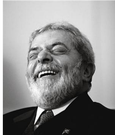
“Só sei que nada sei” - Lula

O conhecimento da verdade sempre foi o objetivo da Filosofia. No entanto a verdade é comprometedor e a ignorância pode parecer benéfica diante da verdade esclarecedora. A célebre frase de Sócrates foi repetida pelo Presidente Lula. As sentenças abaixo falam sobre a relação entre os dois personagens.